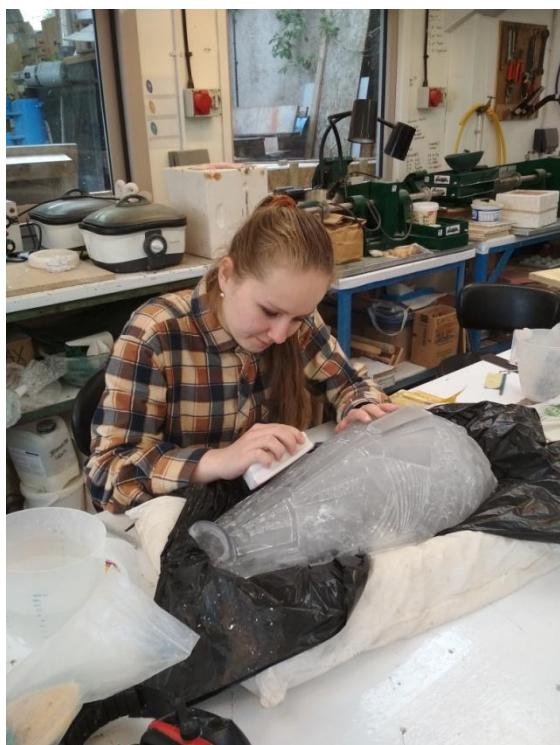
Broušení tavené plastiky

Celkově byla praxe velice zajímavá a naučila jsem se mnoho nových věcí. Také jsem si zlepšila svoji angličtinu v mnoha ohledech. Naučila jsem se nová slovíčka, zlepšila jsem si porozumění či výslovnost. Jsem opravdu ráda, že jsem se mohla něčeho takového zúčastnit a zažít tak opravdu dobrodružnou zahraniční stáž.